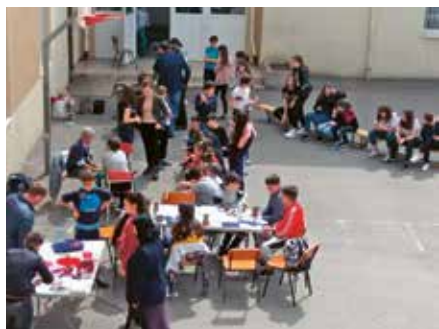
Școala Gimnazială Ion Vișoiu, Chitila