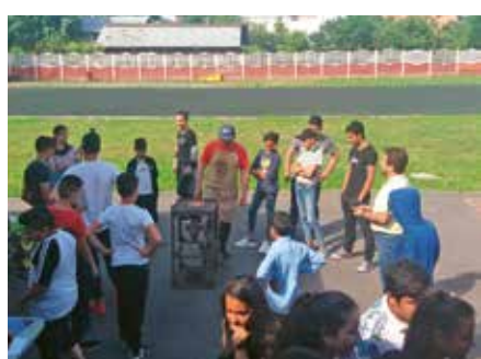
Școala Gimnazială nr.2, Jilava