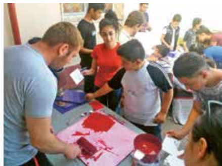
Școala Gimnazială nr.2, Jilava