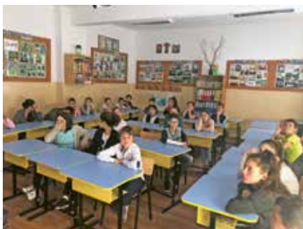
Școala Gimnazială nr.1, Gruiu