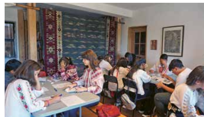
Școala de la Piscu. Concentrați la testul de cunoștințe despre patrimoniul cultural.