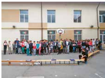
Școala Gimnazială Ion Vișoiu, Chitila