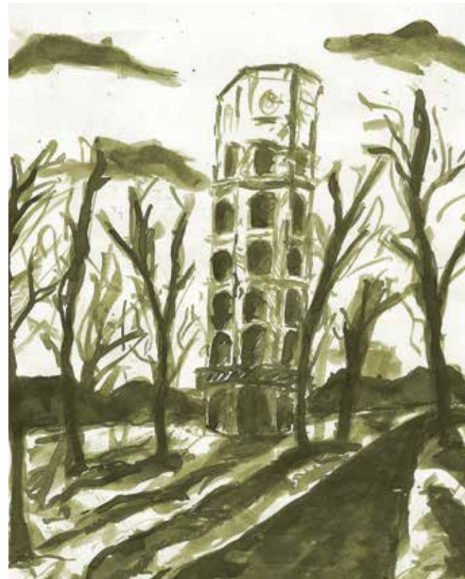
Turnul de apă din Parcul Știrbey de la Buftea , pictat de elevul Alexandru Florea de la Școala Gimnazială Nr. 1 Buftea

În ce privește lucrările de artă plastică, recomandăm schițe după arhitectură/obiecte de patrimoniu, pictură, gravură (acolo unde există îndrumarea necesară), fotografie, dar și alte tehnici. Important este ca acest demers să pună copiii în dialog cu obiectivul/obiectul de patrimoniu, să le prilejuiască privirea atentă a acestuia și observarea elementelor caracteristice. Se pot lucra eșantioane de cusătură după cămăși cusute identificate în comunitate (pentru acest tip de lucrare nu vor fi acceptate decât lucrările inspirate de obiecte vechi). Acestea sunt doar câteva sugestii, suntem deschiși și altor idei atâta timp cât dialoghează cu elementul de patrimoniu.