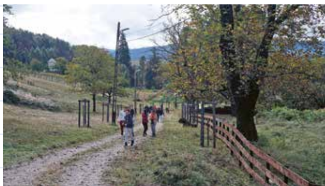
Potecile de la Hurezi, în drum spre Schitul Sfinții Apostoli.

Mănăstirea Hurezi, biserica mare sau cathiconul, cu hramul Sfinții Constantin și Elena, modele ale conducătorilor creștini. În incinta mănăstirii observăm arhitectura brâncovenească pe care o știm bine deja de la Palatul Mogoșoaia. Observăm etape ale stilului brâncovenesc și povestim mult despre cele pictate în biserici și în pridvoare.