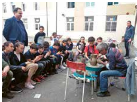
Școala Gimnazială Ion Vișoiu, Chitila