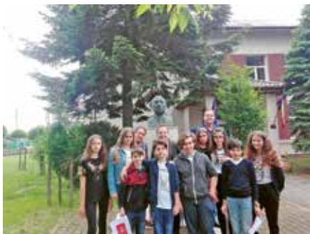
Școala Gimnazială Ion Vișoiu, Chitila