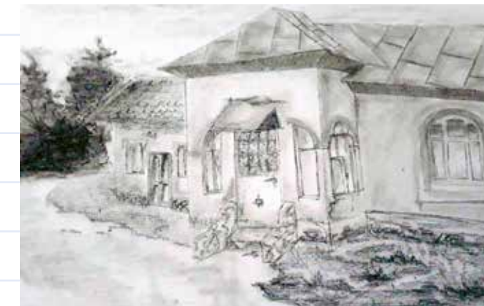
Casă la Buftea , desen realizat de eleva Cosmina Moraru de la Școala Gimnazială Nr.1 Buftea

Pentru localitățile din imediata vecinătate a Bucureștiului care sunt deja aproape în totalitate urbanizate, rog să vă îndreptați atenția către alte sate din apropiere și către monumentele din vecinătate. Putem avea în vedere și monumente din marginea orașului (ex.Fundenii Doamnei).