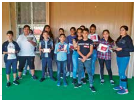
Școala Gimnazială nr.2, Jilava