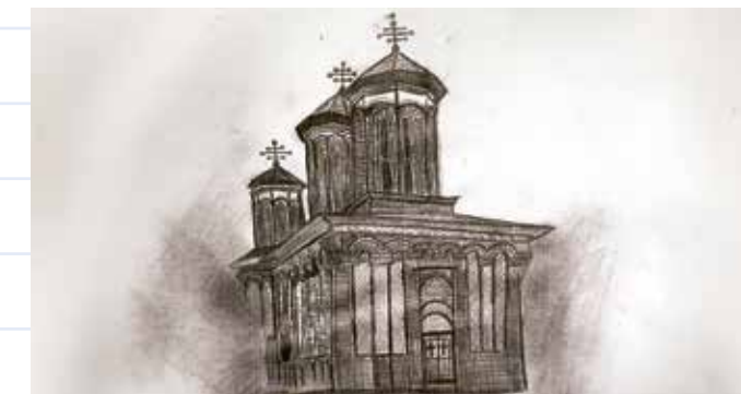
Mănăstirea Snagov , desenată de elevul Cosmin Apostol de la Școala Gimnazială Nr. 1, Ciolpani.