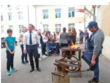
Școala Gimnazială Ion Vișoiu, Chitila