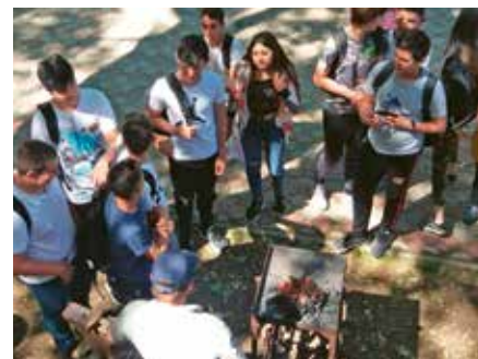
Liceul Teoretic Horia Hulubei, Măgurele

Patrimoniul UNESCO din România Este un material educațional creat în anul 2015, reeditat și adăugit anual pentru a fi distribuit în școli și licee din toată țara. În anul 2019 a fost realizată cea de-a 6-a ediție dedicată elevilor ilfoveni și personalizată pe copertă cu o țesătură ilfoveană, element de patrimoniu UNESCO.