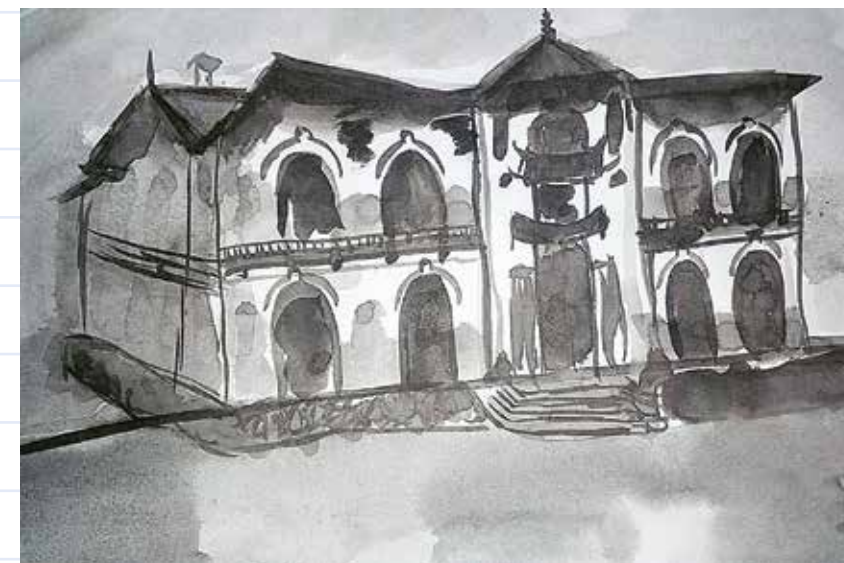
Palatul Știrbey de la Buftea , acuarelă realizată de eleva Teodora Ghiorghită de la Școala Gimnazială Nr. 1 Buftea.