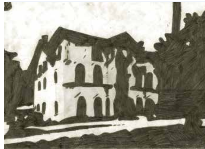
Palatul Știrbey de la Buftea , pictat de Roxana Robu de la Școala Gimnazială Nr. 1 Buftea