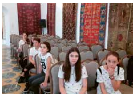
Echipa de elevi de la Ciolpani , la documentare: (1) în casa unei bătrâne din Ciolpani, (2) la Mănăstirea Țigănești, (3) în satul maicălor de la Țigănești, (4) în Sala Scoarțelor la Palatul Mogoșoaia.