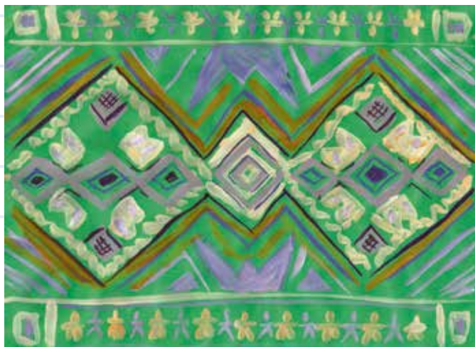
Scoarțe pictate de elevi de la Școala Gimnazială Nr. 1 Buftea: (1) Ariana Anton, (2) Mara Cernea, (3) Teodora Ghiorghită.