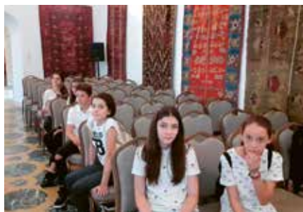
Echipa de elevi de la Ciolpani , la documentare: (1) în casa unei bătrâne din Ciolpani, (2) la Mănăstirea Țigănești, (3) în satul maicălor de la Țigănești, (4) în Sala Scoarțelor la Palatul Mogoșoaia.