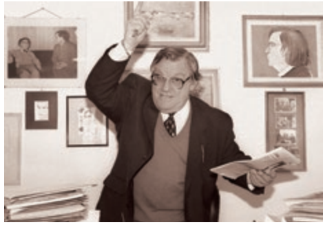
VICTOR COLONELU , regizor de film